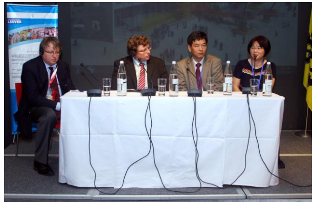
De workshop over valorisatie van onderzoek in het Belgisch paviljoen op de wereldexpo in Shanghai.

Debackere en co stelden in Shanghai het zogenaamde Triple Helix-model voor waarmee de K.U.Leuven de laatste decennia in nauwe samenwerking met overheid,