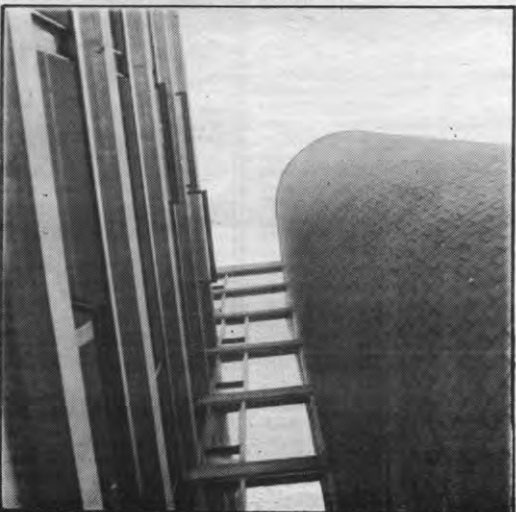
Estetisch uitzicht op de Fakulteit van Wijsbegeerte en Letteren

Goed. Terug naar Neruda. Ook hij wordt dus gerepèreerd. Vermag de literaire kritiek daar wat tegen, of is de literaire kritiek een schakel in het recuperatiemechanisme? Het komt mij voor dat literaire kritiek in aanleg systeembevestigend van aard is. Het is een geïnstitutionaliseerd gegeven, het is een begrip, het is een quasi-noodzakelijk element in het literaire betsel. En in die hoedanigheid is literaire kritiek onvermijdelijk medeplichtig aan het recuperatiemechanisme, hoewel de kritikus ook anders zou willen. Geen gatje, geen barstje, geen stralende zonschijn.