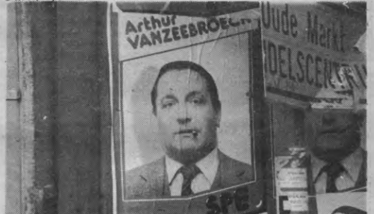
De SPE en haar imago: is Tuur de sigaar of houdt-ie het bij een proletarische halfzware shag?