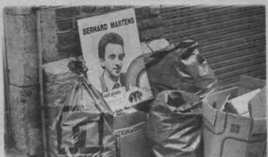
Stil protest van een ontevreden burger: de Christelijke Volkspartij op de vuilnisbelt.