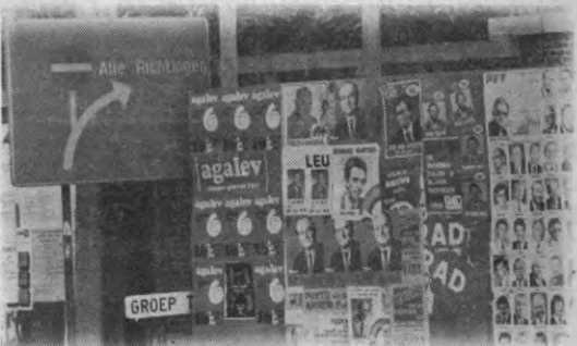
Status quo of ruk naar rechts, enige resterende alternatieven?