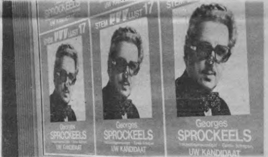
Sprockeels ludiek; Partij, Vrijheid, Vooruitgang: SMURF?