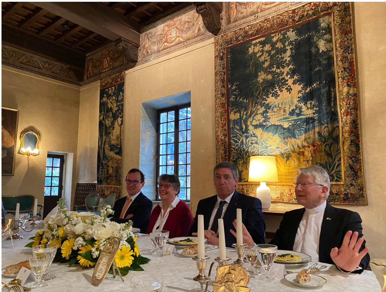
Lunch in de Belgische Ambassade bij de Heilige Stoel in een absoluut schitterend Palazzo, met prachtige wandtapijten !