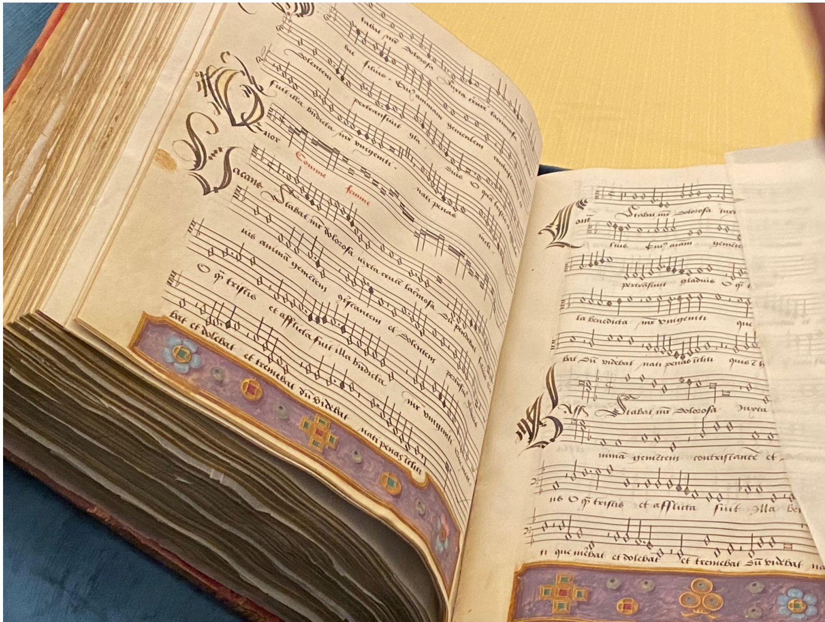
... waar men voor ons de in Vlaanderen geproduceerde Codex Chigi ( https://en.wikipedia.org/wiki/Chigi_codex ) heeft uitgehaald en tentoongespreid, met stukken van Franco-Vlaamse polyfonisten, o.a. Josquin Desprez, Johannes Ockegem, Pierre de la Rue, ...