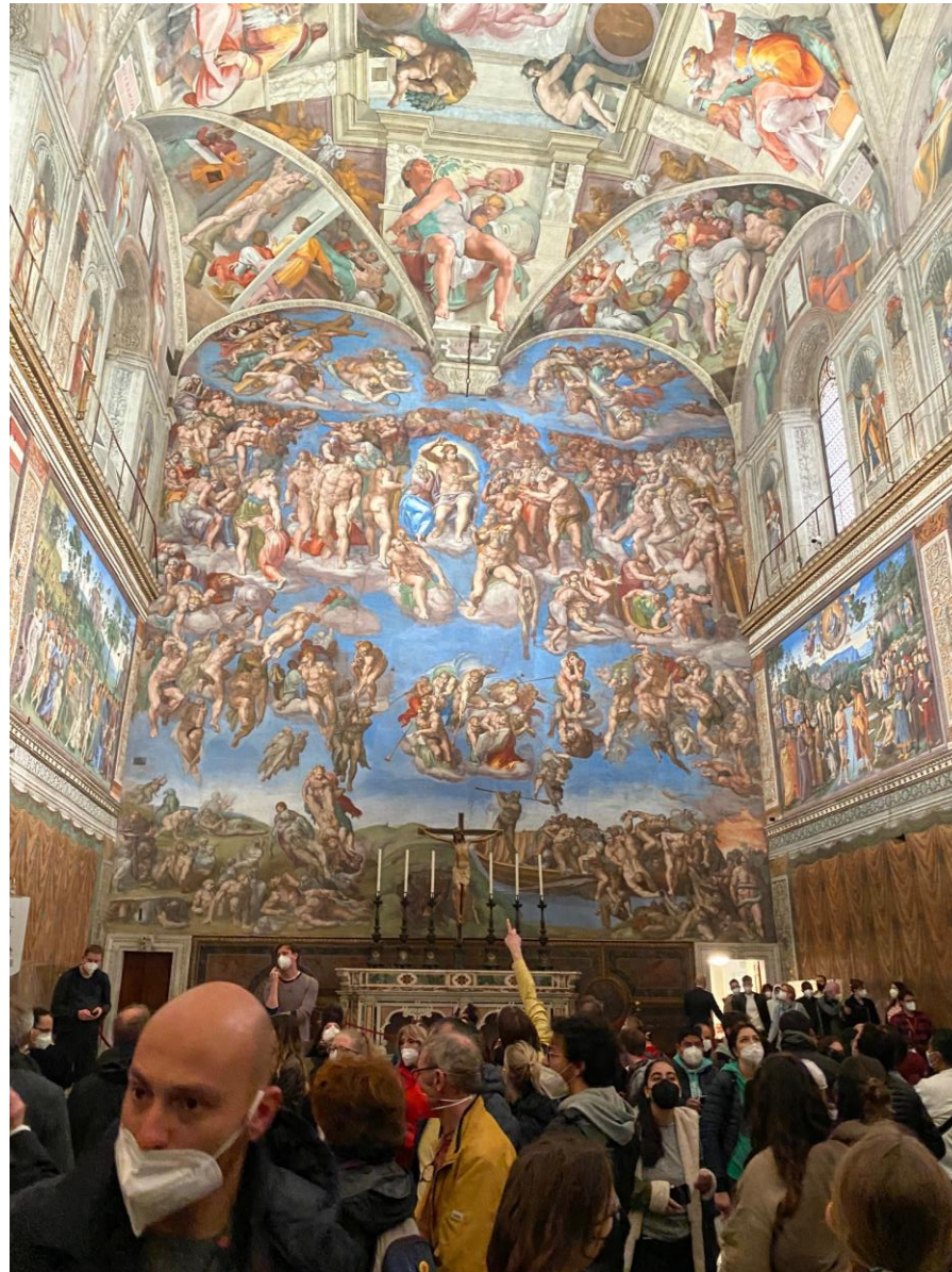
De hele delegatie werd in snel-tempo naar de Sixtijnse kapel geloodst, tussen alle drommen bezoekers door. Michelangelo werkt 5 jaar aan zijn 17 meter hoge fresco....