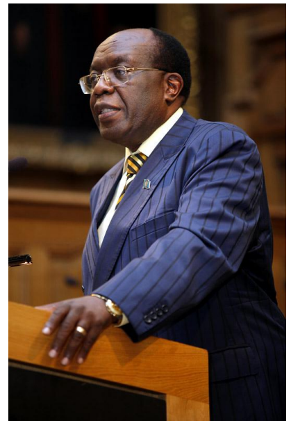
Professor Leonard Mashako Mamba, de Congolese minister voor hoger onderwijs. Lees de toespraak

“Maar er zijn ook nieuwe terreinen. Ons land is perfect geschikt voor onderzoek naar en experimenten met hernieuwbare energie: we hebben volop zon, wind en biomassa. De meerderheid van onze bevolking leeft van de landbouw. Die willen we beter omkaderen met meer opleiding en onderzoek, onder meer rond bemesting en