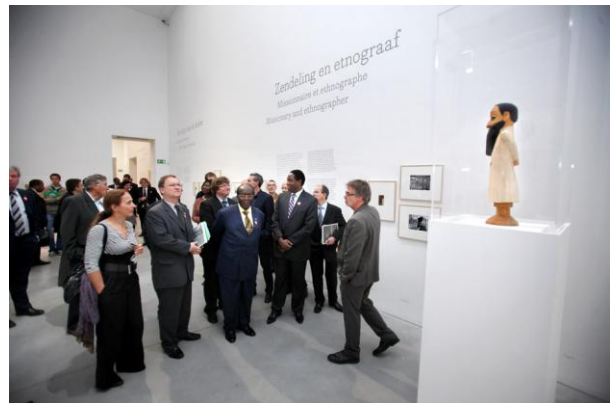
Congolees onderwijsminister Leonard Mashako Mamba bezoekt de expo 'Mayombe. Meesters van de magie' in museum M.

Op donderdag 7 oktober vond de academische zitting 'De universiteiten als motor voor de heropbouw van Congo?' plaats, een gezamenlijk initiatief van K.U.Leuven en Université catholique de Louvain (UCL) naar aanleiding van de viering van 50 jaar Congolese onafhankelijkheid. In het kader daarvan was de Congolese minister van hoger onderwijs Leonard Mashako Mamba te gast in Leuven. Hij bezocht ook de tentoonstelling 'Mayombe' in museum M, die samen met de zitting het hoogtepunt van het Congojaar vormt. In een interview met de Dagkrant pleit Mamba voor een intense samenwerking met de K.U.Leuven en voor meer steun voor zijn relanceplannen binnen het hoger onderwijs in Congo.