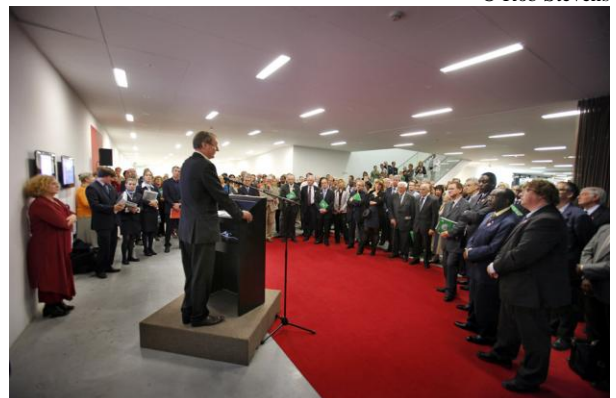
De opening van 'Mayombe. Meesters van de magie' in museum M.