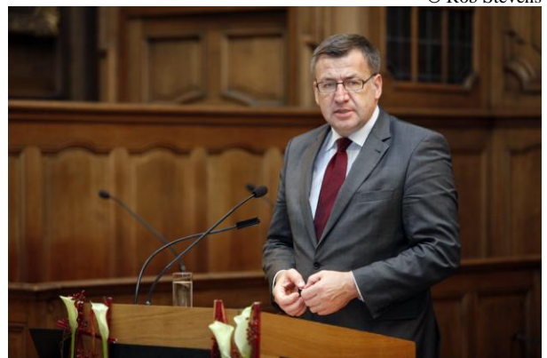
Steven Vanackere, Belgisch minister van Buitenlandse Zaken. Lees de toespraak