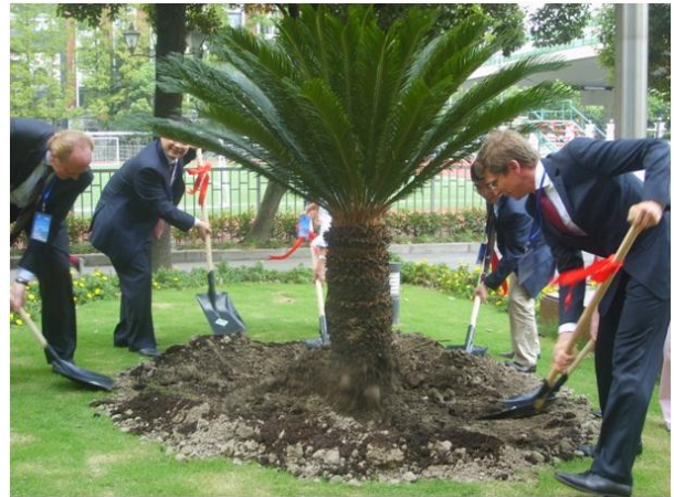
Het planten van de Vriendschapsboom