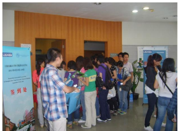
Geïnteresseerde studenten aan de infostand tijdens de K.U.Leuven Days