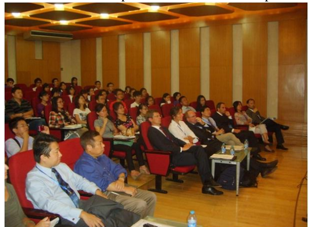
K.U.Leuven-delegatie bij Shanghai Jiaotong University