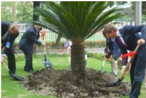
Het planten van de Vriendschapsboom