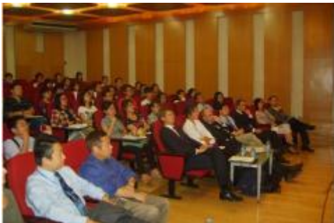
K.U.Leuven-delegatie bij Shanghai Jiaotong University