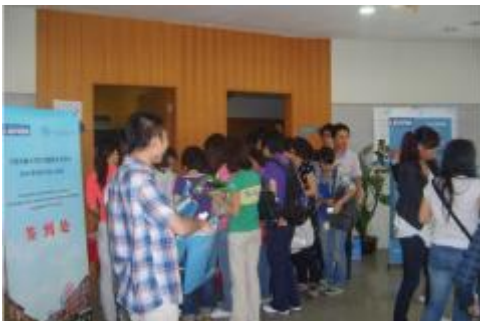
Geïnteresseerde studenten aan de infostand tijdens de K.U.Leuven Days